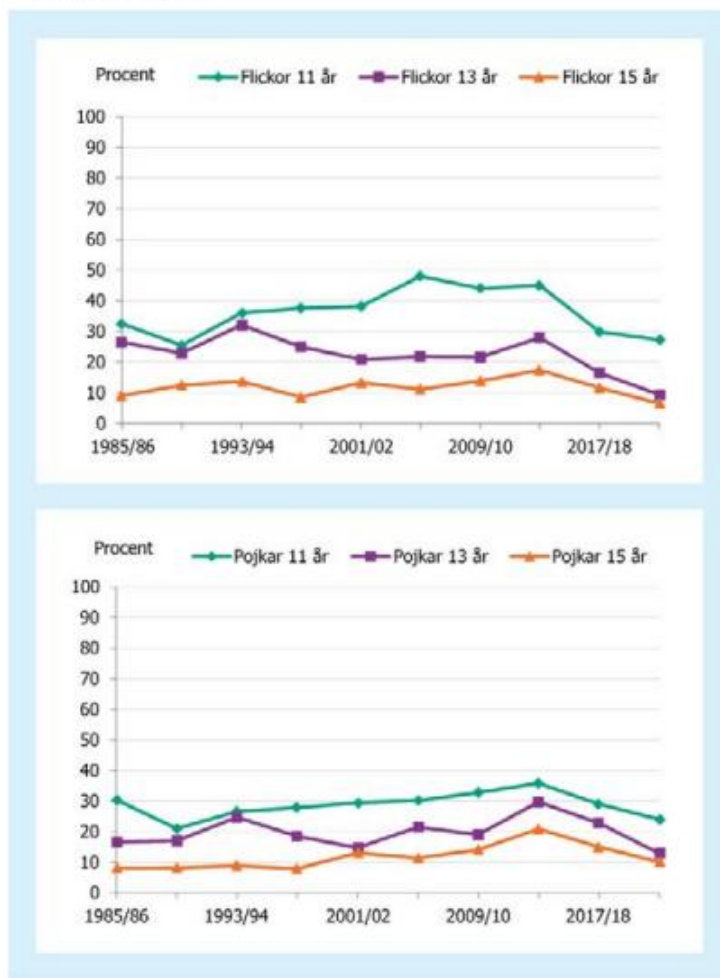
Figur 3.1 Andel (i procent) flickor och pojkar i respektive ålder som tycker mycket bra om skolan, 1985/86–2021/22.